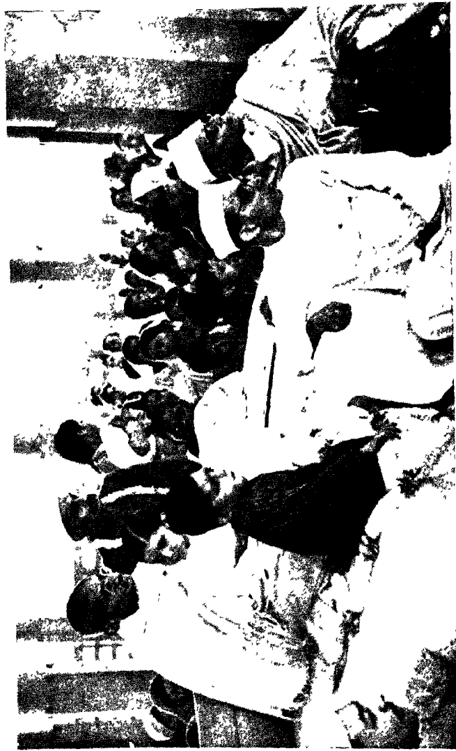
हरिजन-उद्योगशाला के प्रार्थना-मंदिर के उद्घाटन के समय